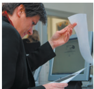
Die Mitarbeiterinnen und Mitarbeiter der Fuchs & Partner Treuhand- und Revisions AG haben stets das wohl des Kunden im Auge.