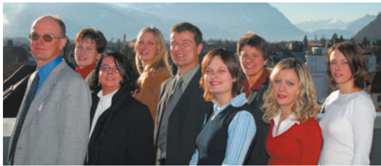
Starten von Interlaken aus zu neuen Horizonten: das Team der Fuchs & Partner Treuhand- und Revisions AG.